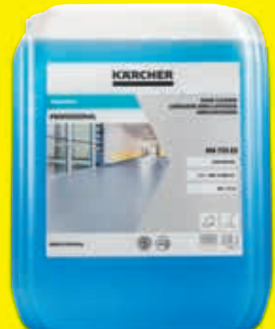
FloorPro Glansreiniger RM 755, 10 L Artnr. 6.295-174.0