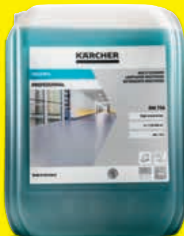
FloorPro multireiniger RM 756, 10 L Artnr. 6.295-914.0