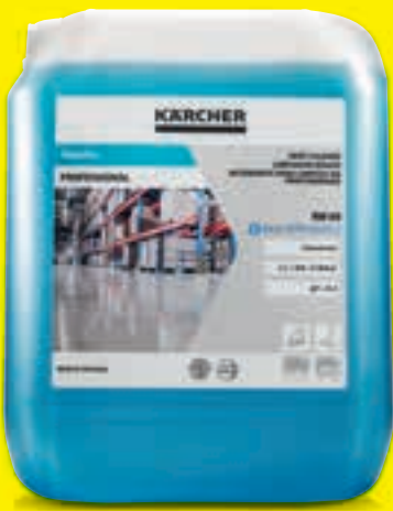
FloorPro basisreiniger RM 69, 10 L Artnr. 6.295-651.0

Kärcher FloorPro reinigingsmiddelen hebben een hoog rendement zodat u sneller en met minder kracht maximale reinigingsresultaten realiseert. Het FloorPro reinigingsmiddel is perfect op uw Kärcher schrob-/zuigmachine afgestemd. Dit betekent dat u uw werkzaamheden gemakkelijker, sneller en comfortabeler kunt uitvoeren. Tegelijkertijd profiteert u van de optimale bescherming die dit reinigingsmiddel biedt aan uw machine en de te reinigen oppervlakken.